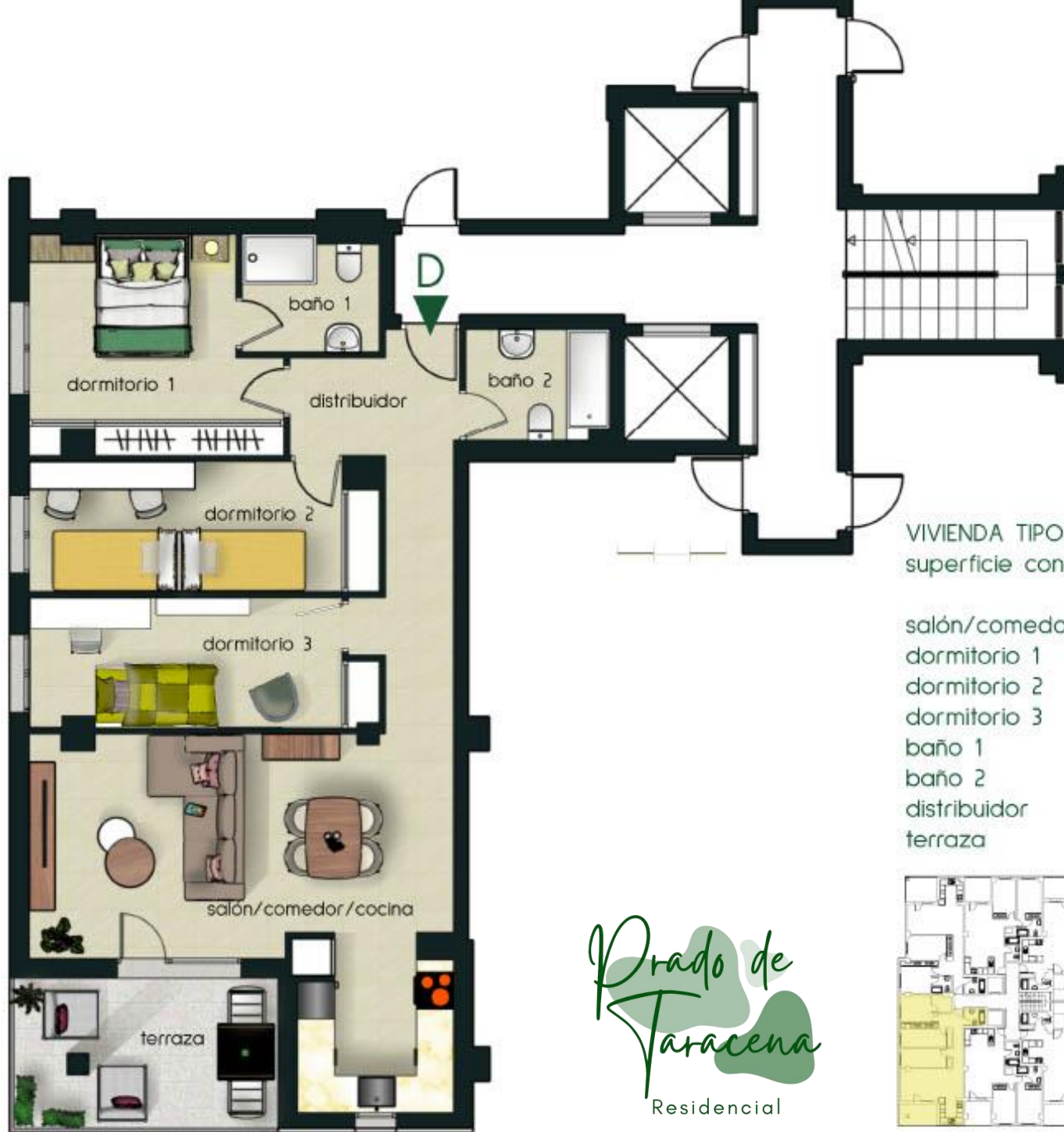
VIVIENDA TIPO D superficie construida 120.27 m 2